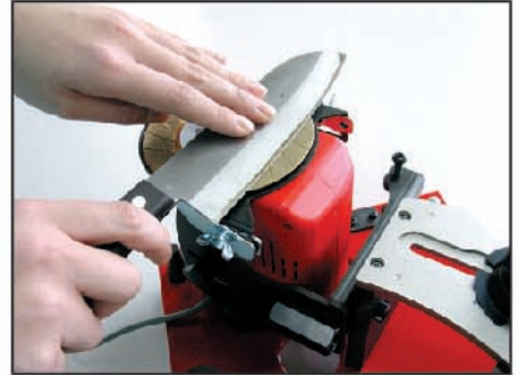
刃物の荒研ぎ (刃欠けの修正)