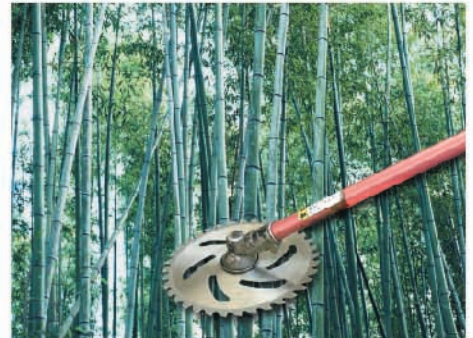
小径雑木・細竹の伐採に…