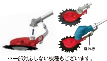
※一部対応しない機種もございます。

お使いのギヤケースをそのまま流用する為、簡単にほぼ全ての刈払機に取り付けできます。また付属の延長板を使用する事で充電式草刈機にも対応しました。